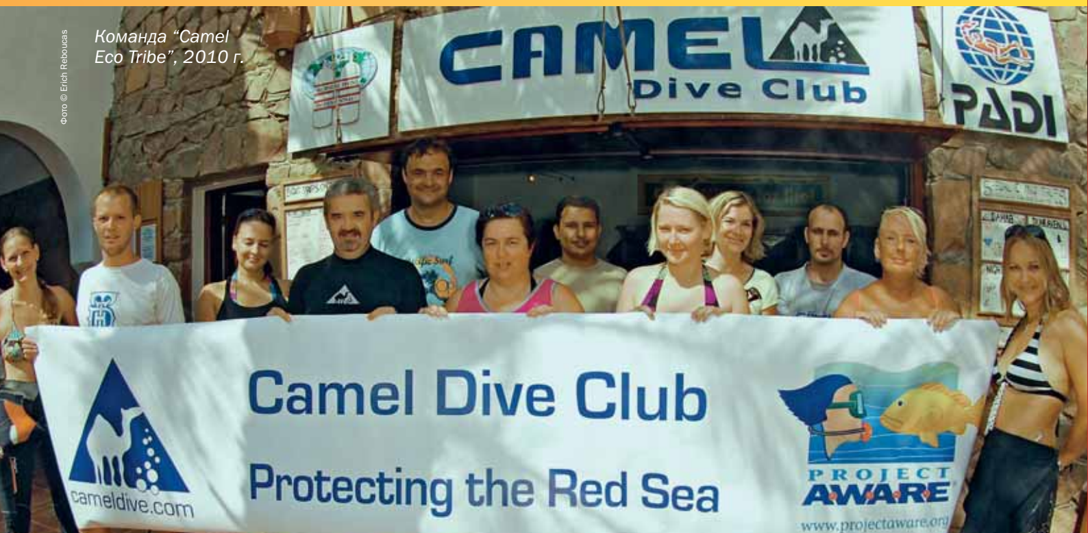
Команда “Camel Eco Tribe”, 2010 г.