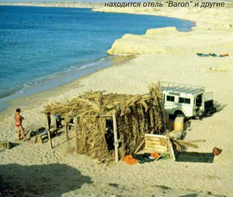
Дайв-сайт Рас-Насрани (Христианский мыс), конец 1980-х гг. Сейчас здесь находится отель "Baron" и другие