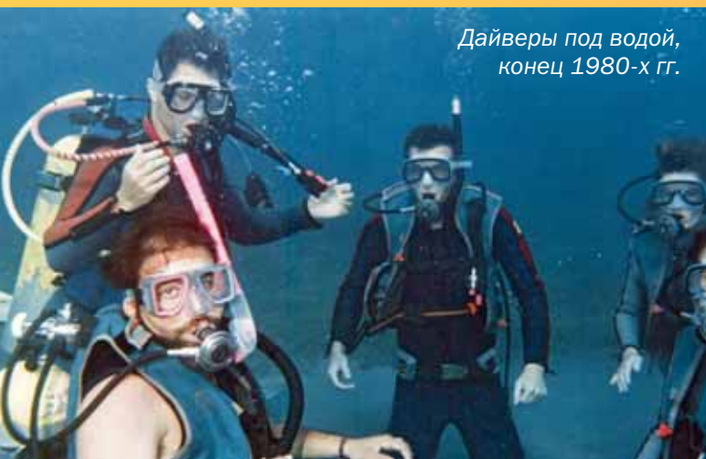
Дайверы под водой, конец 1980-х гг.