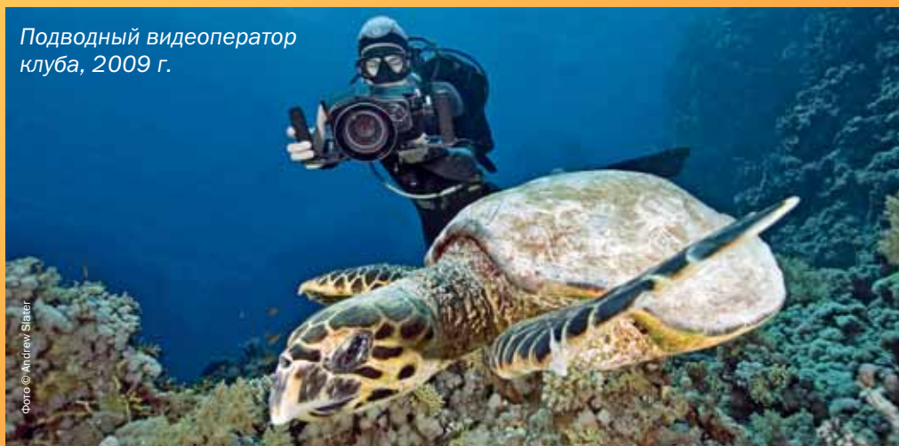
Подводный видеоператор клуба, 2009 г.