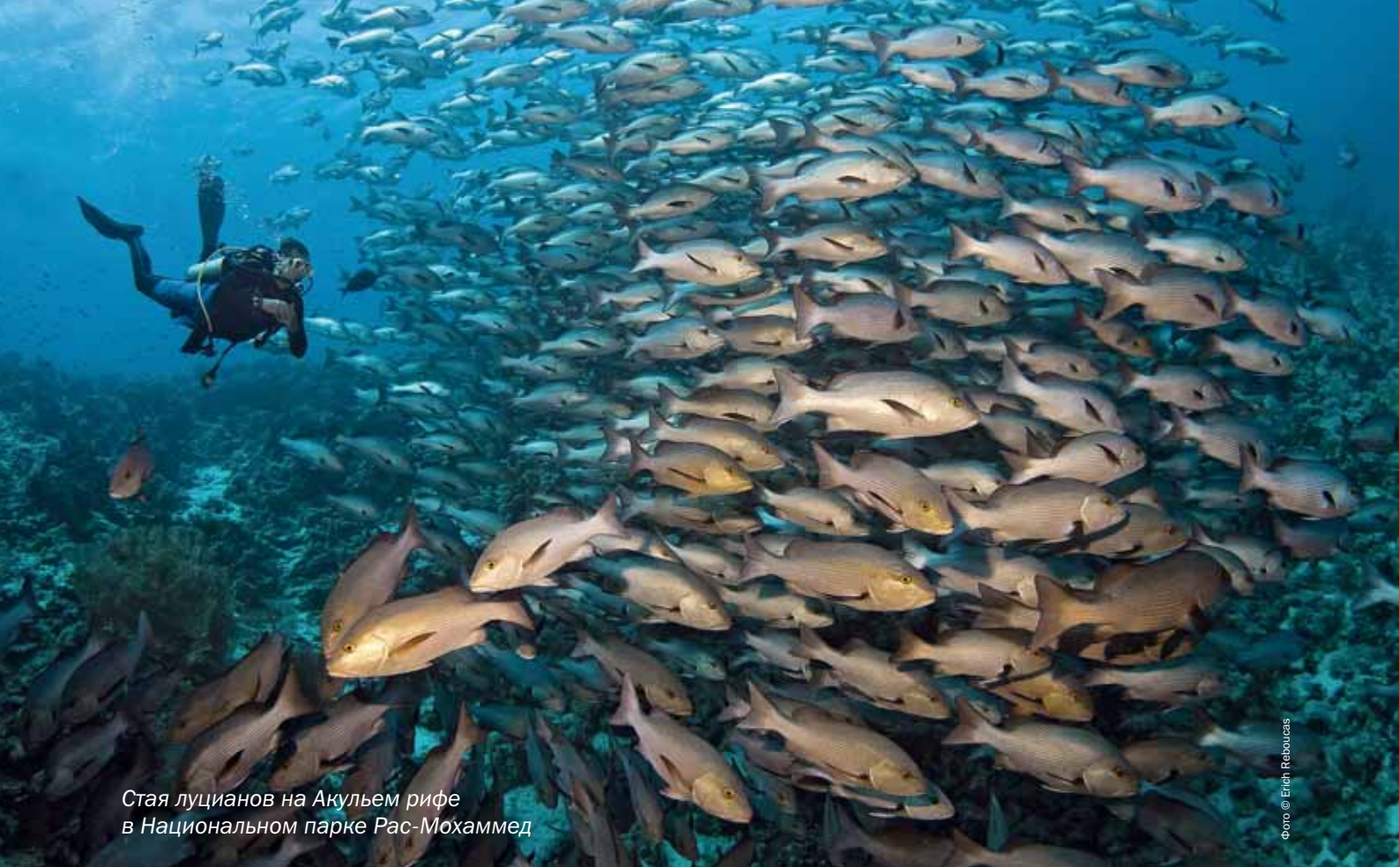
Стая луцианов на Акульем рифе в Национальном парке Рас-Мохаммед