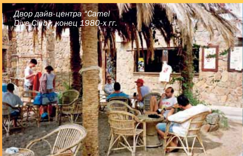
Двор дайв-центра "Camel Dive Club", конец 1980-х гг.