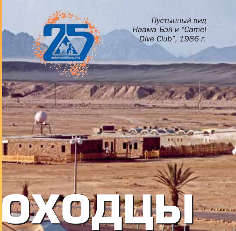
Пустынный вид Наама-Бэй и "Camel Dive Club", 1986 г.