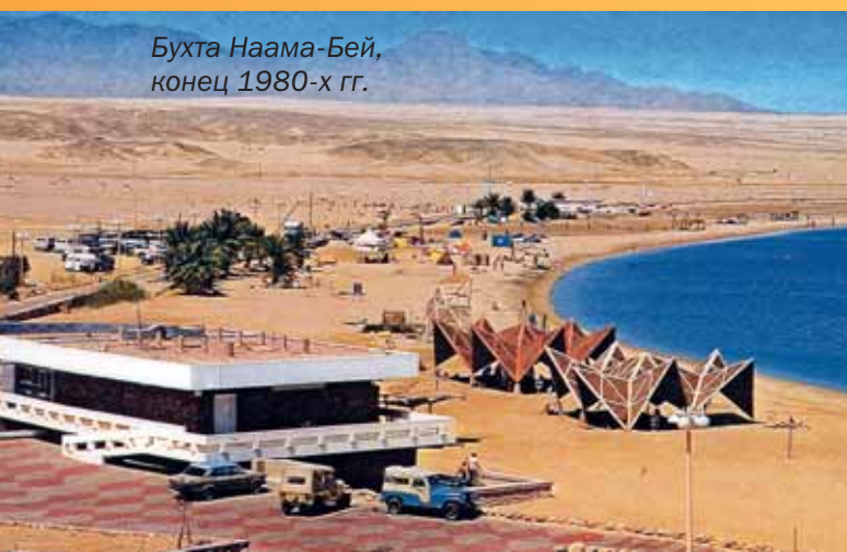
Бухта Наама-Бей, конец 1980-х гг.