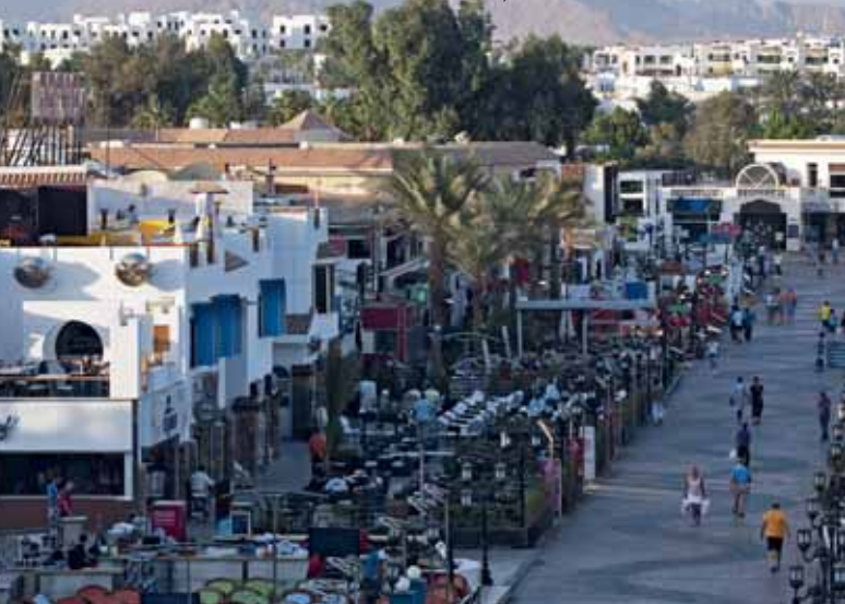
Главный променад в Наама-Бей и “Camel Dive Club & Hotel”, 2011 г.