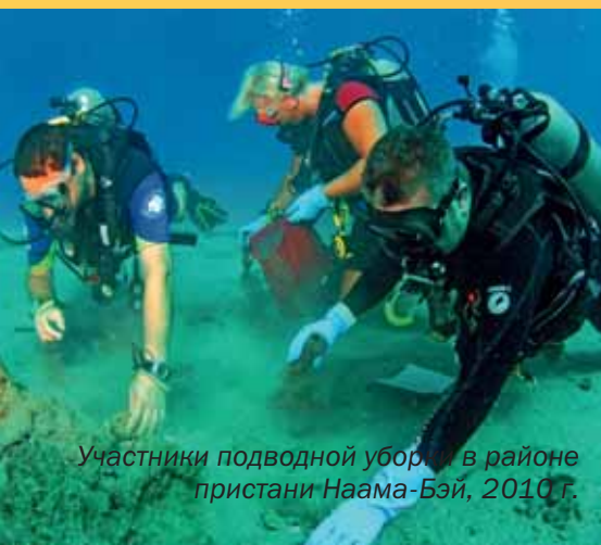
Участники подводной уборки в районе пристани Наама-Бэй, 2010 г.

PADI Accessibility Award, 2007 – за вклад в развитие любительского дайвинга для инвалидов.